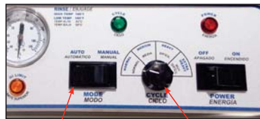
Ajuste "Automatic" (Automático) Configuración de ciclos