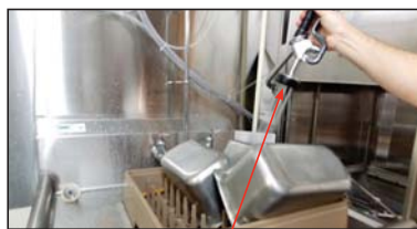
Manguera de pre-enjuague