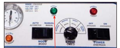
Luz de ciclo